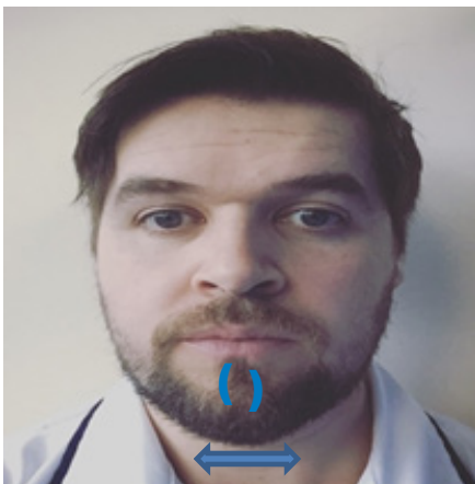
Chin - circles, strokes