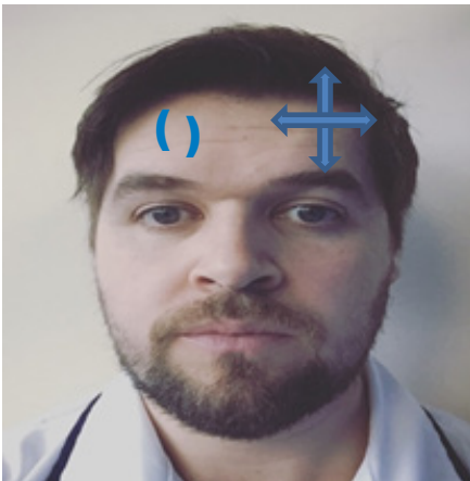
Forehead – circles/ lines vertical / horizontal